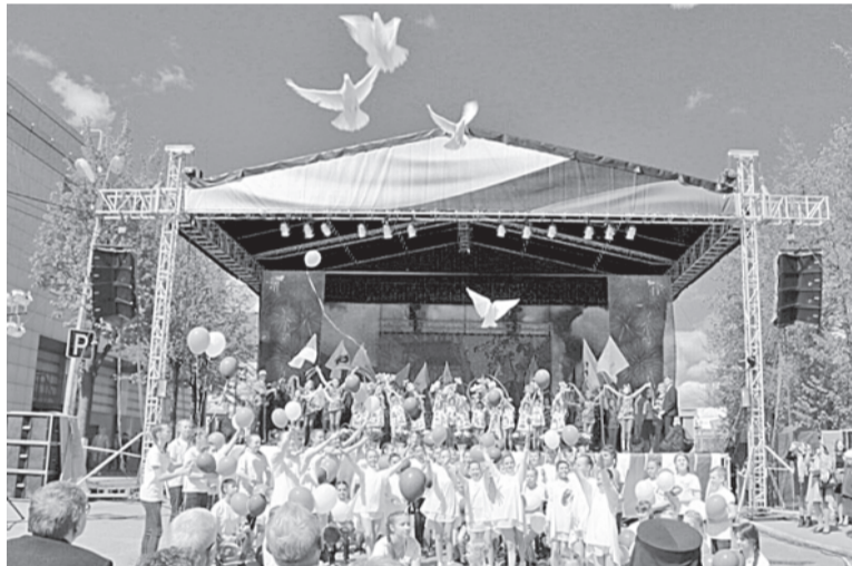
На главной сцене выступило больше тысячи артистов